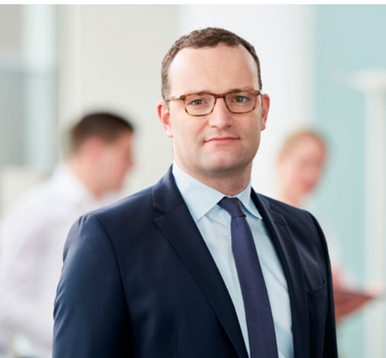
Gesundheitsminister Jens Spahn