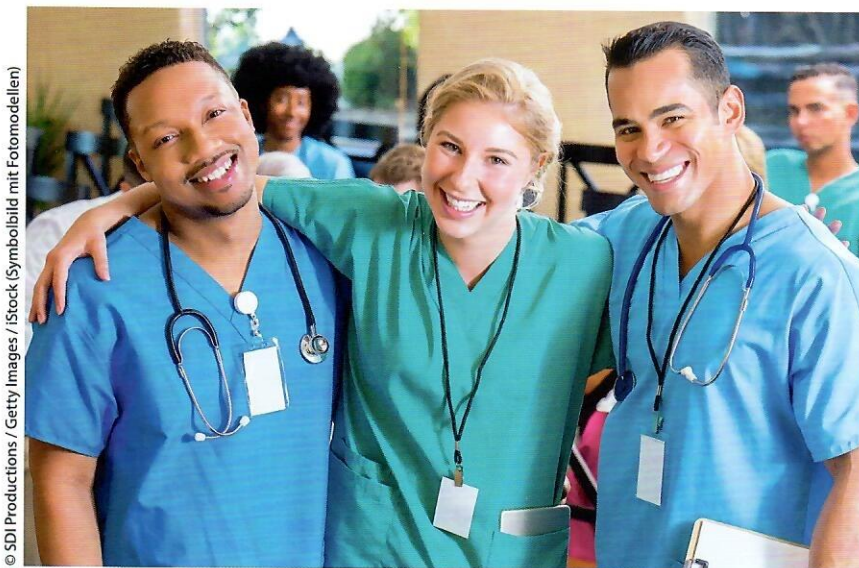
© SDI Productions / Getty Images / iStock (Symbolbild mit Fotomodellen)

Zudem muss das gesamte Team in den Integrationsprozess eingebunden wer-