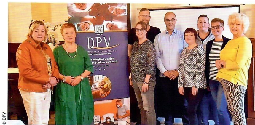
Der Vorstand und die Delegierten – Momentaufnahme während der Klausur

Die Klausurtagung war ein voller Erfolg. Durch den intensiven Austausch konnten wir klare Ziele und Strategien für die nächsten Jahre definieren. Die beschlossenen Maßnahmen werden dazu beitragen, die Position des Deut-