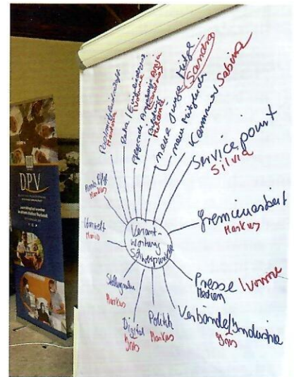
Sammlung von Ideen und Anregungen

schon Pflegeverbands als starke Stimme für die Pflege zu festigen und entscheidende Verbesserungen für die Pflegekräfte und die zu Pflegenden in Deutschland zu erreichen.